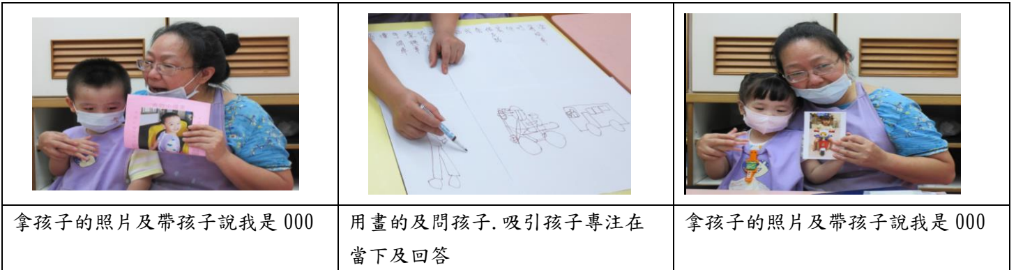
拿孩子的照片及帶孩子說我是 000

1100830-我怎麼來學校-本要問孩子早上誰帶你來(敏感字). 但孩子還未全適應完成. 所以只能問孩子怎麼來-公車/捷運/開車/騎摩托車/走路來. 簡易帶孩子認識同學